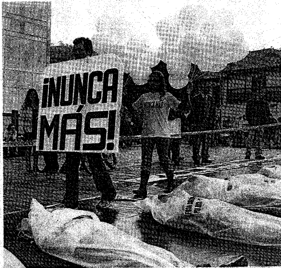
Las organizaciones aseguran que en este Gobierno hay una abierta promoción de la impunidad en relación con los 'paras'.

El lunes, el presidente Uribe se reunió con Pillay en Nueva York, donde la Comisionada reconoció que hay "avances concretos, pero también dificultades", contó el canciller Jaime Bermúdez.