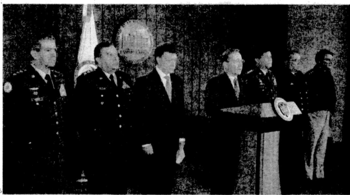
En compañía de los altos militares, el presidente de la República, Álvaro Uribe dijo que «el prestigio de las Fuerzas Armadas de Colombia, en el corazón del pueblo y en la comunidad internacional, no puede mancharse por los delitos, por las fallas administrativas que algunos de sus integrantes cometan».

Se conoció también que todos los hechos están siendo investigados penal y disciplinariamente