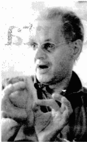
El ex magistrado Juan Ángel Palacio Hincapié.

vo fiscal tendrá que darse en un ambiente en el que se han presentado fuertes rifirrafes entre el Ejecutivo y la Corte, por temas como los seguimientos del DAS a