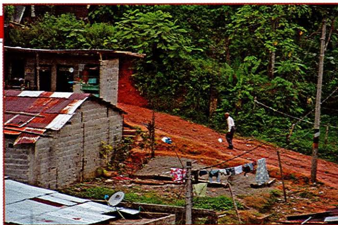
▲ La zona norte, la más poblada y la más pobre de Quibdó, es un objetivo de todos los grupos armados, que reclutan a sus jóvenes.