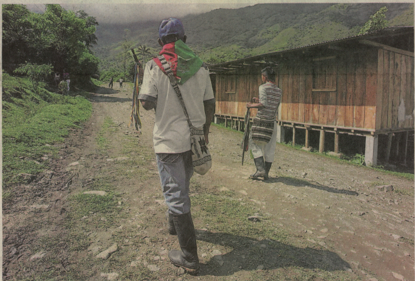
Indígenas de la vereda El Sesteadero, de Toribío (Cauca), se movilizan para capturar a los responsables de la muerte de dos líderes nasas. Capturaron a 8 presuntos guerrilleros, entre ellos a 2 menores. Están en asamblea permanente, mientras juzgan a los homicidas.