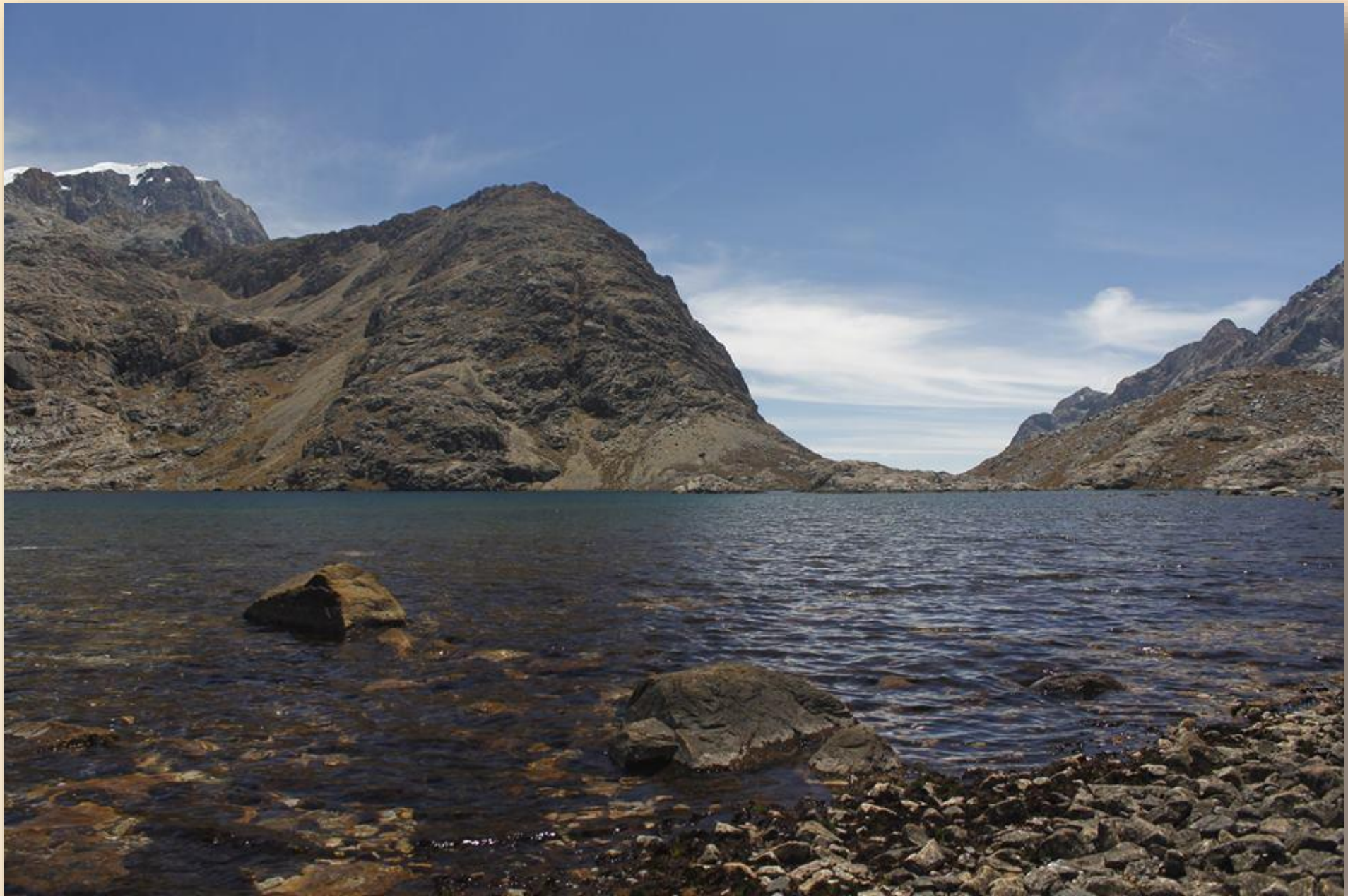
Laguna sagrada. Mandiwa Sierra nevada de santa marta