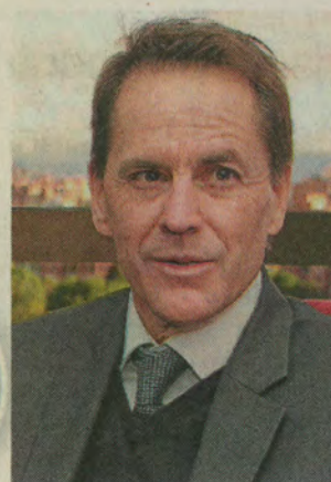
Todd Howland, de la Oficina de Derechos Humanos de la ONU.

Esta iniciativa surgió debido al duro debate suscitado en torno a un eje clave del posconflicto: el retorno de campesinos a los terrenos que les fueron despojados por los grupos ilegales, el cual ha subido de tono por afirmaciones en contra y a favor de estos procesos.