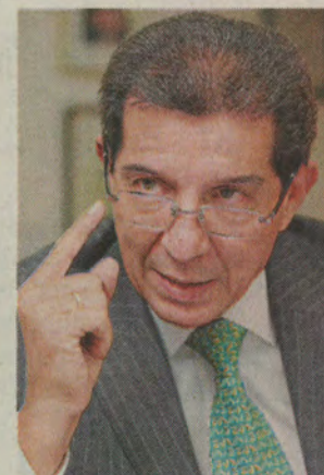
José Félix Lafaurie, presidente de Fedegán.

Fedegán, por ejemplo, asegura que un factor generador de nueva violencia puede surgir de la forma como la norma “afecta” a los pequeños propietarios que adquirieron los terrenos de forma legal, pero a quienes se les revoca la propiedad del terreno porque son reclamados por víctimas del conflicto. Lafaurie, líder del gremio, dice que en muchas situaciones los actuales dueños no conocían los antecedentes de los predios.