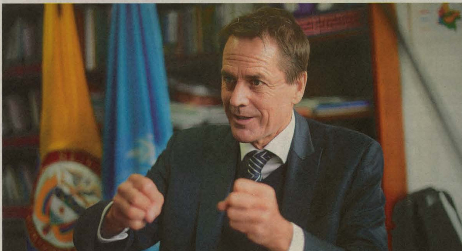
Según Howland, "los debates en Colombia suelen estancarse a partir de lecturas que polarizan y que son extremas". / Cristian Garavito