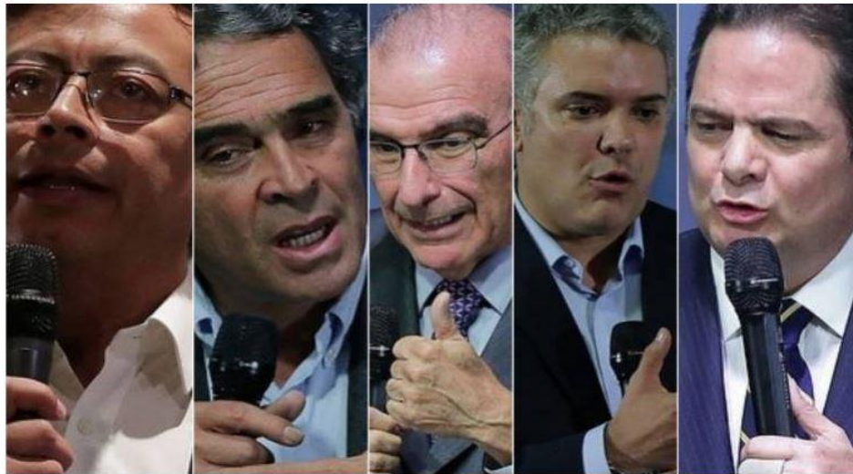
Candidatos presidenciales 2018

Los cinco aspirantes firmaron el Pacto Social por los Derechos Humanos.