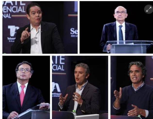
Los candidatos presidenciales que disputarán las elecciones el domingo 27 de mayo

El alto comisionado de esa oficina de la ONU en Colombia, el italiano Alberto Brunori, quien asumió el cargo el pasado 9 de mayo, aseguró durante la presentación del pacto en Bogotá que los derechos juegan un rol "central" para recuperar la confianza social, el ejercicio del poder público y en la consolidación del Estado de derecho.